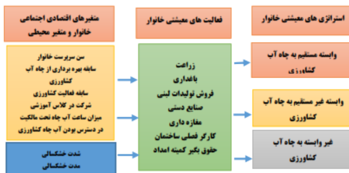
شکل ۱. چارچوب نظری تحقیق

یکی از پرکاربردترین شیوه‌های سنجش استراتژی معیشتی خانوار سنجش سهم منابع درآمدی گروه‌های مورد تحقیق (نلسن و همکاران، ۲۰۱۳: ۵۷؛ هوآ و همکاران، ۲۰۱۷: ۶۴؛ سلطانی و همکاران، ۲۰۱۲: ۶۱) و تنوع تعداد فعالیت‌های درآمدزا (نلسن و همکاران، ۲۰۱۳؛ ولتین و همکاران، ۲۰۱۷: ۱۷۷؛ خاتیوادا و همکاران، ۲۰۱۷: ۶۱۱) است. مطالعات پیشین نشان داده است که استراتژی‌های معیشتی خانوار تحت تأثیر متغیرهای بیوفیزیکی و اقتصادی - اجتماعی گسترده‌ای است (جانسن و همکاران، ۲۰۰۶: ۱۴۲؛ سلطانی و همکاران، ۲۰۱۲: ۶۷؛ بارت و همکاران، ۲۰۰۱: ۳۱۶؛ هوآ و همکاران، ۲۰۱۷: ۶۷؛ خاتیوادا و همکاران، ۲۰۱۷: ۶۱۲؛ غزالی و همکاران، ۱۳۹۶: ۶۳). در تحقیق حاضر علاوه بر متغیرهای استخراج‌شده از مطالعات پیشین، دو متغیر میزان سهم آب کشاورزی و دسترسی به آب چاه کشاورزی به دلیل اهمیت آب چاه کشاورزی در اقتصاد خانوار روستایی استان خراسان جنوبی مدنظر قرار گرفته است. بر این اساس چارچوب نظری تحقیق در شکل ذیل ارائه شده است.