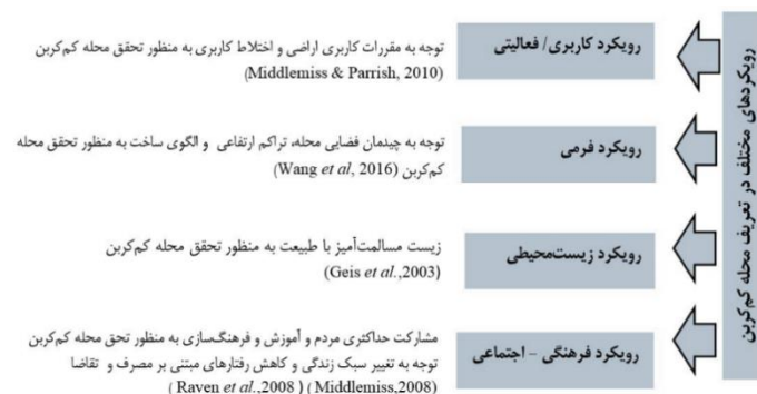
شکل ۱. رویکردهای مختلف در تعریف محله کم‌کربن

مناسب و سبز، معماری سبز، استفاده از انرژی کارآمد، بازیافت و استفاده مجدد از مواد زائد و مشارکت عمومی تعریف شده است (وانگ و همکاران ۱ ، ۲۰۱۶).