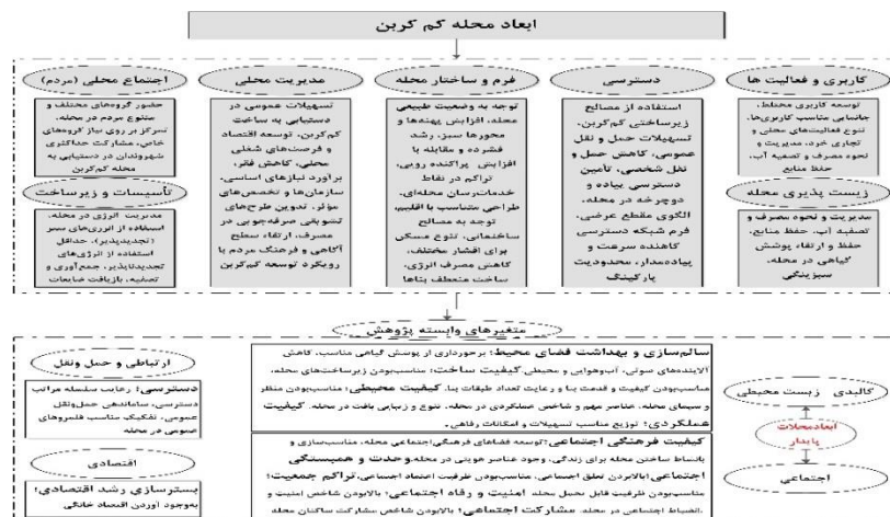
شکل ۲. چارچوب نظری پژوهش

محلله‌های پایدار است. دانشمندان برای دستیابی به جامعه «کم‌کربن» و «توسعه پایدار»، تمرکز خود را بر روی طراحی سیستم‌های ارزیابی «محلله کم‌کربن» معطوف کرده‌اند. از این رو، با استفاده از اصول و مبانی رویکرد «محلله کم‌کربن» می‌توان به محلله‌های شهری پایدار دست یافت. پایداری محلله‌ها در برنامه‌ریزی شهری دارای یک اصل است که بااهمیت‌ترین آن، عدالت و برابری و حفظ توازن به‌منظور دستیابی به پایداری محلله‌های سطح شهر است. بنابراین در جامعه کنونی برای دستیابی به توسعه پایدار شهری، محلله‌ها از اهمیت ویژه‌ای برخوردارند. توسعه پایدار محلی نیز همانند رویکرد کم‌کربن بر پایه «توسعه اجتماعات محلی»، «زیست‌پذیری»، «مشارکت حداکثری مردم» و ... بنا شده است. حل مشکل و مسائل از درون محلله با ترکیب سرمایه‌های طبیعی، کالبدی، اجتماعی و انسانی و پیروی از مبانی و اصول رویکرد کم‌کربن در محلله‌های پایدار شهری مقدور خواهد بود. که در این بین، ابعاد محلله کم‌کربن به‌عنوان متغیرهای مستقل و شاخص‌های پایدار بیانگر متغیرهای وابسته پژوهش در شکل زیر به‌عنوان چارچوب نظری پژوهش نمایان است.