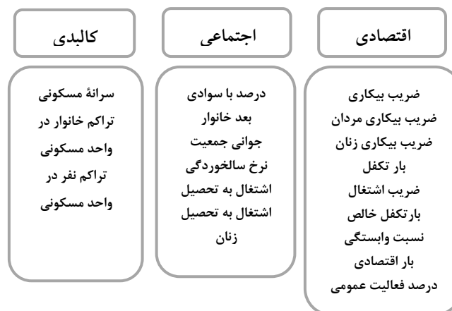
شکل ۲. ابعاد و شاخص‌های فقر شهری

رویکرد کلی حاکم بر پژوهش را می‌توان در زمره دیدگاه اقتصاد سیاسی دانست. پژوهش حاضر از نظر هدف در دسته پژوهش‌های کاربردی- توسعه‌ای قرار می‌گیرد که با روش توصیفی- تحلیلی انجام گرفته است. جامعه آماری پژوهش، بلوک‌های مسکونی شهر مراغه بوده و مأخذ اسناد شاخص‌های مورد استفاده، داده‌های بلوک‌های آماری سرشماری عمومی و نفوس مسکن ۱۳۹۰ و نقشه‌های GIS معاونت برنامه‌ریزی استان آذربایجان شرقی است. برای ارزیابی موضوعات قابل بررسی در مقوله سنجش فقر و خصیصه‌های تأثیرگذار بر آن و برای نیل به اهداف پژوهش، ۱۸ شاخص در قالب سه دسته مؤلفه اجتماعی، اقتصادی و کالبدی انتخاب سپس با استفاده از روش کوپراس به رتبه‌بندی محلات شهر بر اساس شاخص‌های فوق و ترسیم نقشه توزیع فضایی فقر در شهر مراغه اقدام شده است.