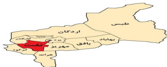
شکل ۱. موقعیت جغرافیایی استان یزد و شهرستان تفت (مأخذ: نگارنده، ۱۳۹۵)

در پژوهش حاضر برای بررسی موشکافانه مسئله تحقیق از رویکرد کیفی و روش نظریه بنیادی بهره‌گیری شده است. در این روش، مجموعه‌ای منطقاً منسجم از داده‌ها و روندهای تحلیلی با هدف ساخت نظریه فراهم می‌شود. این روندها به شناسایی الگوهای درون داده‌ها کمک کرده و محققان با تحلیل آنها می‌توانند نظریه‌ای بسازند که در عمل نیز معتبر باشد. شهرستان تفت، در جنوب غربی استان یزد با وسعتی حدود ۱۴ کیلومتر مربع، واقع در عرض جغرافیایی ۳۱ درجه و ۴۵ دقیقه و طول جغرافیایی ۵۴ درجه و ۱۲ دقیقه واقع شده است. مهم‌ترین علت انتخاب شهر تفت به عنوان مورد مطالعه شرایط یکسان توپوگرافی و اقلیم در محدوده قنات‌های آن است.